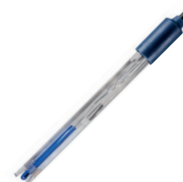
201 T DHS

Elettrodo digitale di pH combinato con tecnologia DHS. Sensore di temperatura incorporato Corpo in plastica per usi generali. Esente da manutenzione. pH: 0...14 - T: 0...60 °C cod: 32200103