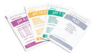
Soluzioni di taratura

Cella di conducibilità in epoxy, C=1 sensore di temperatura incorporato, cavo fisso 1 m. Campo di lavoro 10 \mu S...200 mS cod: 50004002